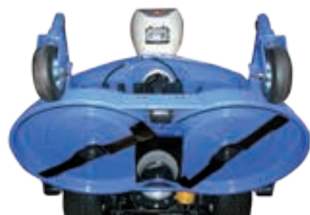
Výborná kvalita sečení je dosažena umístěním dvou nožů na žací liště.