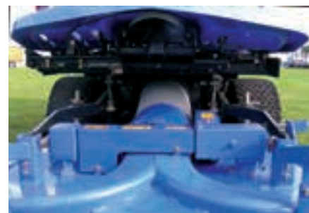
Krátká vzdálenost sání od žací lišty k sací turbíně.