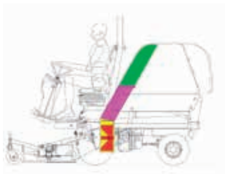
Centrální sací turbína je poháněna přímo (bez pomoci klínového řemenu) klikovou hřídelí motoru.

Nové čelní sekačky SFH 220 a SFH 240 zcela odpovídají požadavkům profesionálních uživatelů. Provedení žací lišty navazuje na úspěšný model SXG, který svoji výkonnost prokázal již mnohokrát. Možnost vyklápění sběrného koše do výšky a velký sběrný koš umožňují provádět veškeré práce rychle a efektivně.