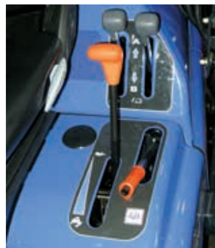
Model SFH 240 je sériově vybaven tempomatem pro plynulé nastavení konstantní rychlosti a hydrostatickým pohonem ILS od ISEKI.