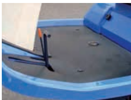
Jezděte pohodlně novým SFH: prostorná plošina pro řidiče skýtá dostatek prostoru pro chodidla a nohy.